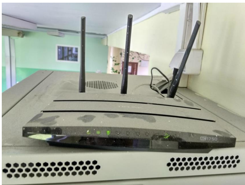
Fot. 2: Zdjęcie punktu dostępowego model TP-Link Archer C7