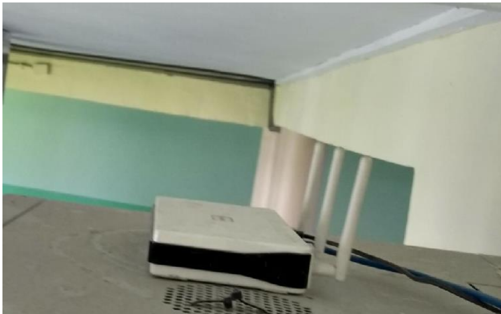
Fot. 1: Zdjęcie punktu dostępowego model D-Link DIR 655 C1