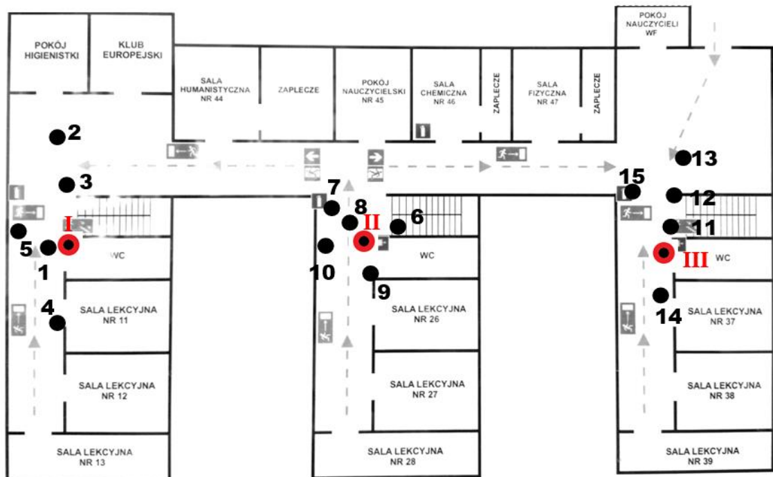
Rys. 1b: Plan rozmieszczenia punktów pomiarowych – I piętro, kolorem czerwonym oznaczono lokalizację punktów dostępowych