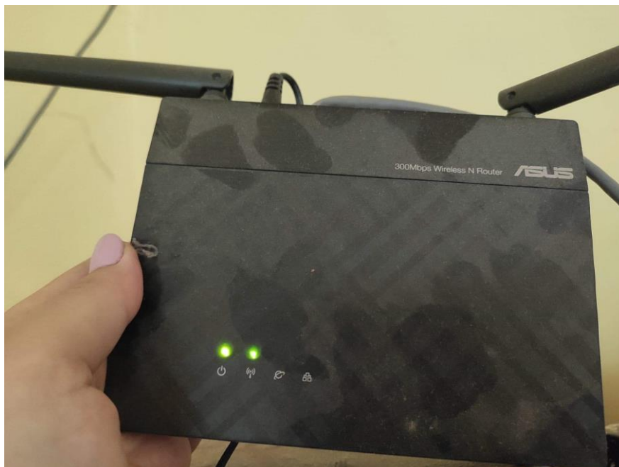
Fot. 3: Zdjęcie punktu dostępowego model RT-N12+