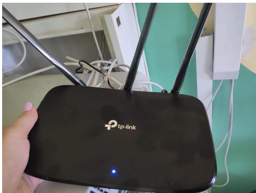
Fot. 2: Zdjęcie punktu dostępowego model TL-WR940N