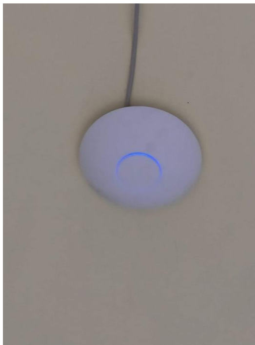
Fot. 1: Zdjęcie punktu dostępowego model UniFi UP AC PRO