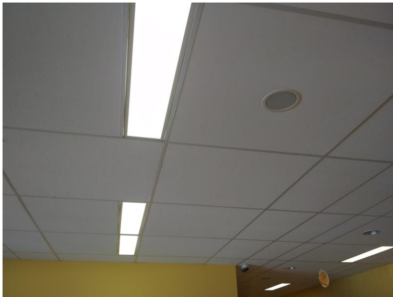
Fot. 1: Punkt dostępowy NETGEAR WNDAP360 umieszczony nad sufitem podwieszanym