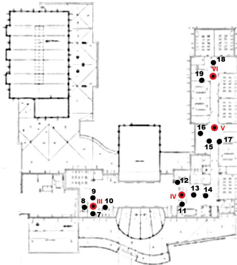
Rys. 1b: Plan rozmieszczenia punktów pomiarowych – I piętro kolorem czerwonym oznaczono lokalizację punktów dostępnych